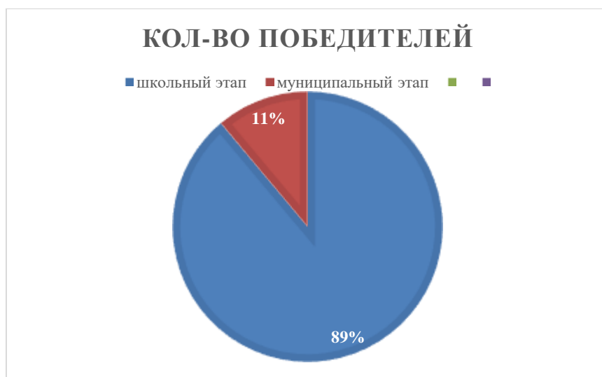
Диаграмма по результатам участия школьников во ВсОШ

сделать вывод о готовности МОУ ИРМО «Малоголоустннская СОШ» к реализации ключевых приоритетов Национального проекта «Образование».